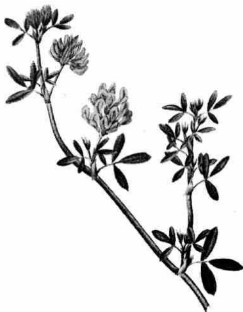
Gullucern Medicago falcata . Bilden är hämtad från C.A.M. Lindman 1922: Bilder ur Nordens Flora . Stockholm.

För Eds socken är några växtlokaler kända, som icke blev upptagna för fjärde exkursionen, dit de hör. Vid Almarestäket eller Norra Stäket växer kärffibbla Crepis paludosa , stormåra Galium album , Geum rivale Xurbanum , gullusern Medicago falcata och ängsstarr