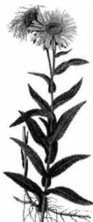
Krisla ( Inula salicina ) som hittats omkring kruthuset, vid Katrinelund och på norra stranden av Ekholmssjön. Bilden är hämtad ur Lindman, C. A. M., 1926: Bilder Ur Nordens Flora . Stockholm.

I närheten av Larsberg på Lidingön förekommer lungört Pulmonaria obscura , rödkörvel Torilis japonica , spenört Laserpitium latifolium och åkerkål Brassica rapa ssp. sylvestris . På havsstranden söder om bron: gulkämpar Plantago maritima och norrlandsstarr Carex aquatilis .