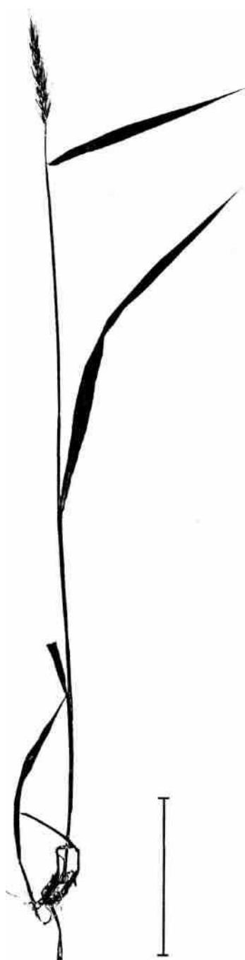
Hordelymus europaeus (skogskorn). Skalstreck 1 dm.